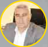
صمد ر سولوی بنیس شرکت درنا شخصیت صنعت غذای سال ۱۳۹۷