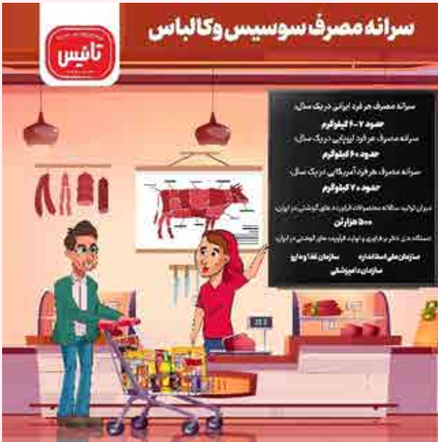
شکل ۱- سرانه مصرف سوسیس و کالباس