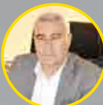
صمدر سولوی بنیس شرکت درنا شخصیت صنعت غذای سال ۱۳۹۷