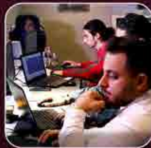
طراحی و پشتیبانی سایت