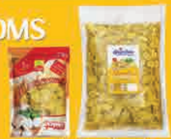
قارچ بلنچ پاستوریزه

شوکت گشت و صنعت قارچ و صنایع غذایی، پارس شهریار